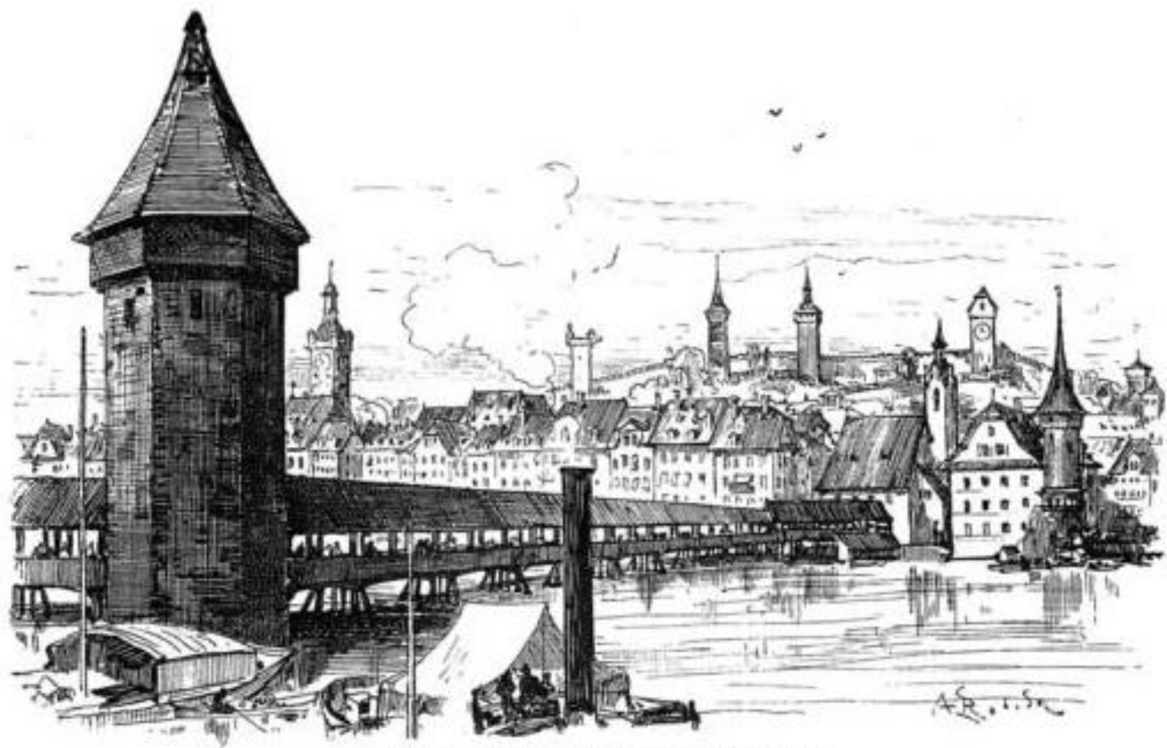
Lucerne. — Le grand pont de bois et la Wasserturm.